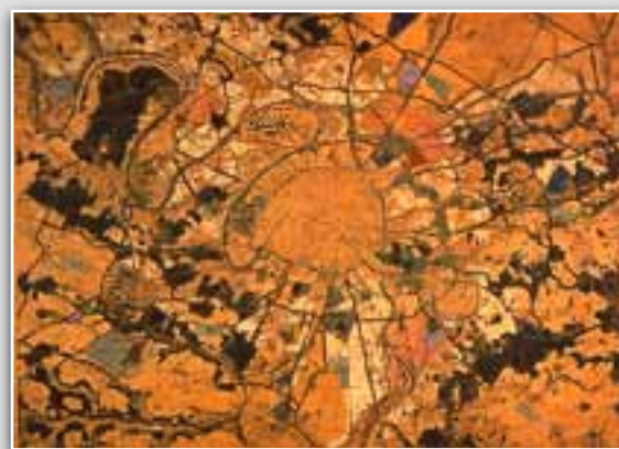
Inzending van Léon Jausse voor de stedenbouwkundige prijsvraag voor Le Grand Paris. 1919.

Tien teams dachten na over de toekomst van de Parijse metropool in het tijdperk na Kyoto. Het wel en wee van een internationale raadpleging.