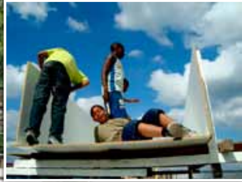
In de buurttuin op de site van Thurn & Taxis in Brussel kweken de deelnemers samen op ecologische wijze groenten en fruit.

Op de bouwspelplaats op de site van Thurn & Taxis kunnen kinderen uit de omliggende buurten - met een groot gebrek aan speelruimte - gedurende drie weken onder ervaren begeleiding een echt "kamp" bouwen.