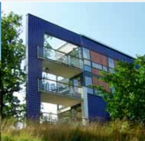
De straatprofielen, de maat van de bouwblokken, de bouwhoogte, de bouwdichtheid en de mix van typologieën en functies zijn afgestemd op maximale openheid, veel groen en licht, en een sterke band met het water.