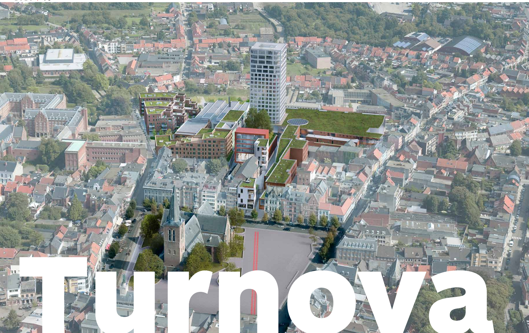
Luchtbeeld van de Turnova site

Naar aanleiding van het vijfhonderdste geboortjaar van Gilbert Van Schoonbeke werd in 2019 door de vzw De Vrienden van het Brouwershuis een internationale Award 1 gelanceerd om deze merkwaardige ondernemer uit de Antwerpse Gouden Eeuw onder de aandacht te brengen. De prijs ging naar een boeiend project in Turnhout.