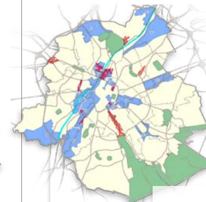
figuur 2: De selectie van de Hefboomgebieden is geen vertaling van beleidsprioriteiten.